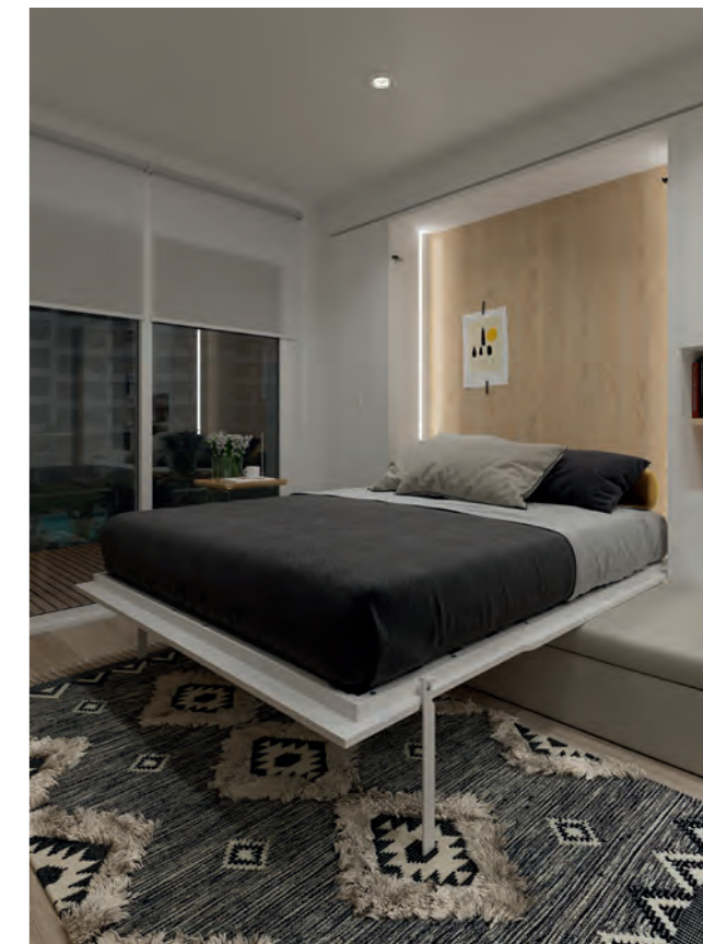
“DETALLE DE LA TIRA CON LUZ LED OPCIONAL PARA CAMA ABATIBLE VERTICAL” “DETAIL OF THE LED LIGHT STRIP, OPTIONAL, FOR VERTICAL FOLDING BED”

To lower the vertical folding bed, we will keep the backrest cushions inside the chest under the sofa seat. The metal frame of the bed and the legs are available in white and carbon finish.